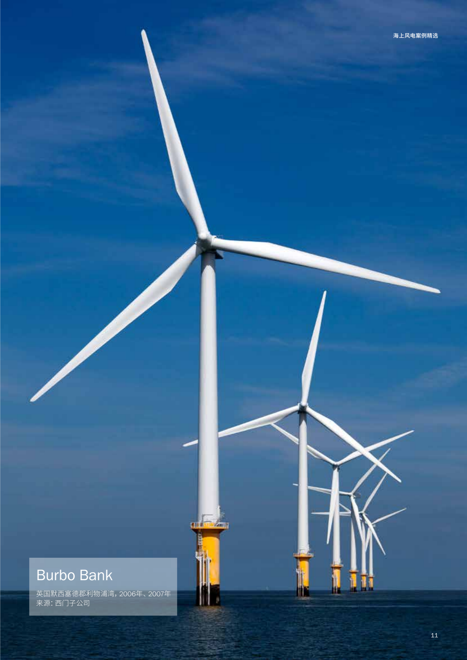
Burbo Bank 英国默西塞德郡利物浦湾，2006年、2007年